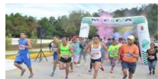
Realiza CEPSVyPC la Carrera de Colores por la Juventud 2017 en SCLC – Icoso Chiapas | Chiapas nos une 15 de Agosto del 2017 Como parte del programa de convivencia ciudadana que realiza el Centro Estatal de Prevención Social de la Violencia y Participación... ICOSP/SAFEG/OJOS/01