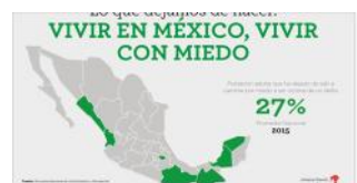
Vivir en México, vivir con miedo – México Evalúa Tamaulipas, Chiapas y Coahuila son los estados donde la percepción sobre la inseguridad ha breado las mayores repercusiones en la vida cotidiana de las personas. MEXICO/EVALUA/01