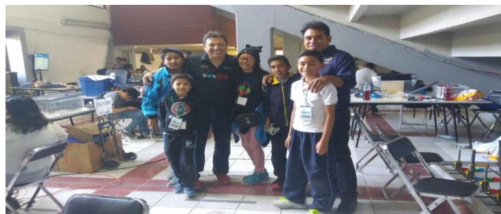
Blvd. Fidel Velázquez S/N, Las Águilas, Tuxtla Gutiérrez, Chiapas

Tel. (961) 6179700 www.sesesp.chiapas.gob.mx