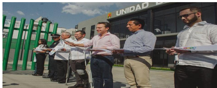
Bvdo. Fider Velazquez S/N, Las Águilas, Tuxtla Gutiérrez, Chiapas

Tel. (961) 6179700 www.sesesp.chiapas.gob.mx